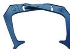
Ratlankio pločio matuoklis