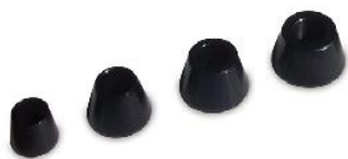
Centravimo kūgių rinkinys